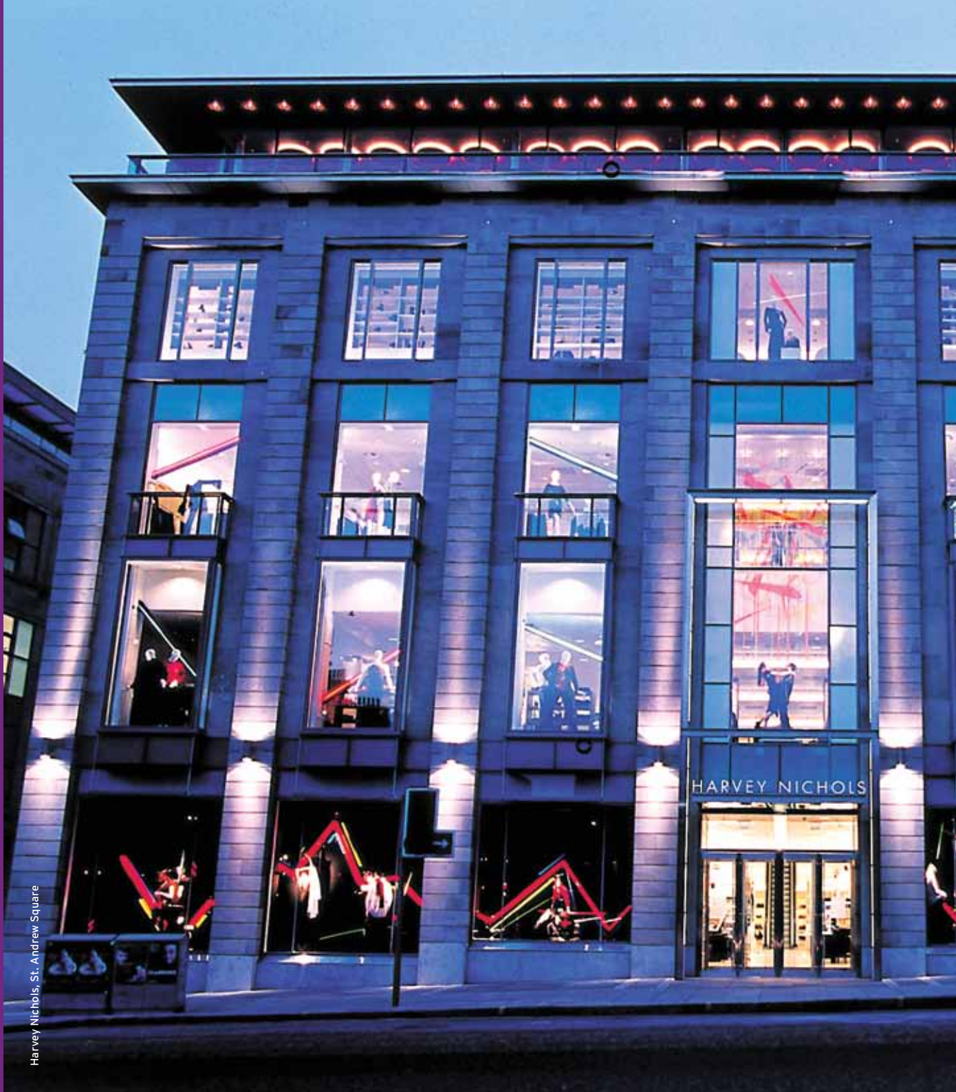
Harvey Nichols, St. Andrew Square