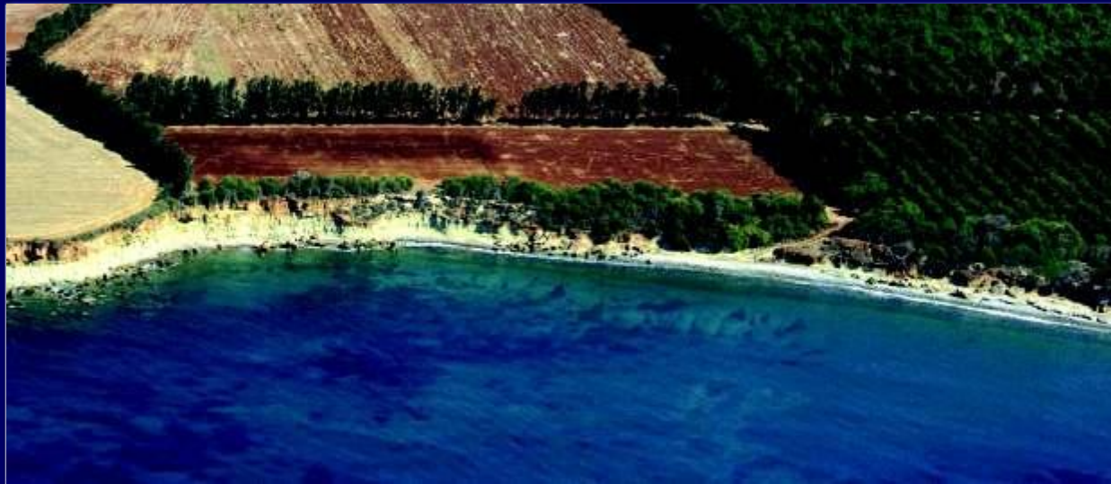
马吉奥科沿海地块 MAGIOKO COASTAL PLOT